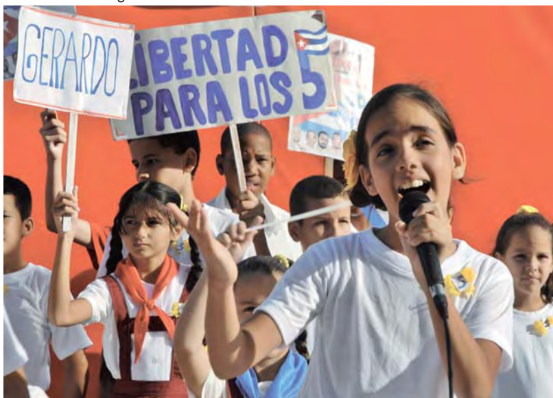
Estudiantes en La Loma de la Cruz, Holguín.