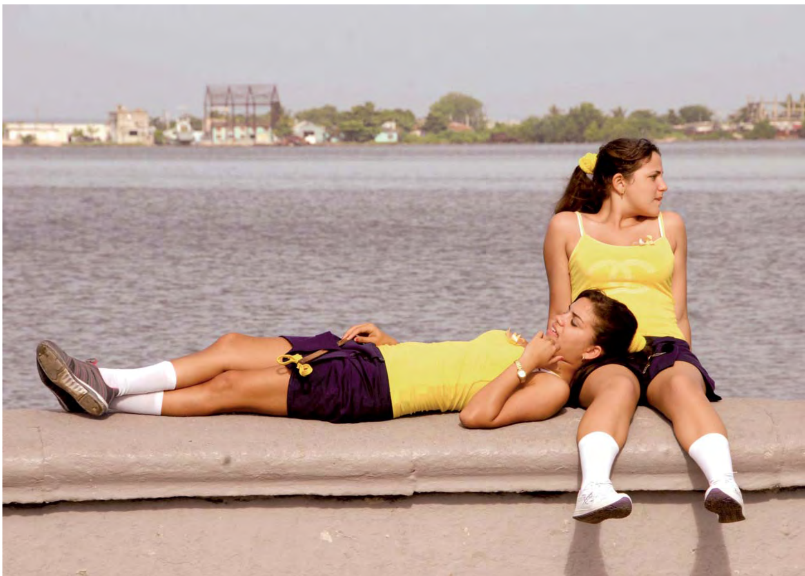
Estudiantes cienfuegueras visten blusas de color amarillo.

De modo que, a pesar de que el imperio norteamericano apretó deliberadamente con las leyes Torricelli -1992- y Helms-Burton -1996- seriamente convencidos de que los cubanos ya no resistirían durante mucho tiempo, aquel y la reacción de origen cubano que esperaban asistir al entierro del proceso revolucionario para retomar el control de la Isla, debieron de deshacer las maletas que ya tenían preparadas para regresar a Cuba; sencillamente porque, como dijera Cintio Vitier, “donde esperaban encontrar un vacío ideológico los estaba esperando el pueblo de Céspedes, de Maceo y de Martí, algo más que una ideología, una vocación concreta de justicia y libertad”.