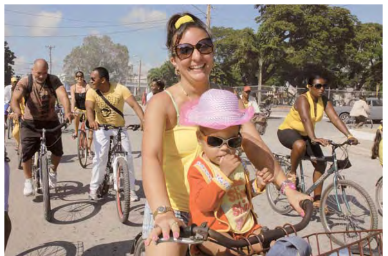
Marcha “Cinco por Los Cinco” en Camagüey.