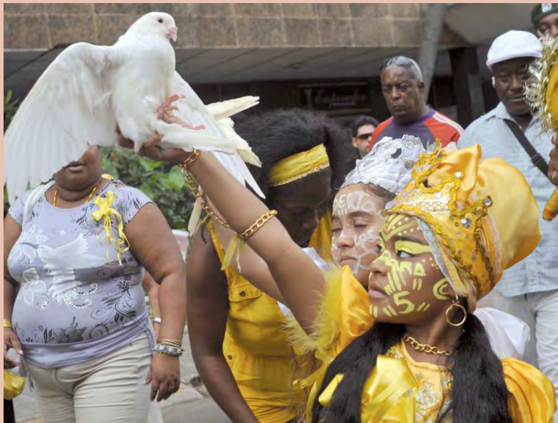
Participantes de la peregrinación convocada por los intelectuales cubanos a favor de la liberación de Los Cinco, en La Habana.

plir íntegramente su condena, explicó que la cinta amarilla se emplea en EEUU como símbolo para quien espera el retorno de un ser querido. La idea de llenar Cuba y el mundo de cintas amarillas pretendió hacer llegar este injusto caso a la opinión pública