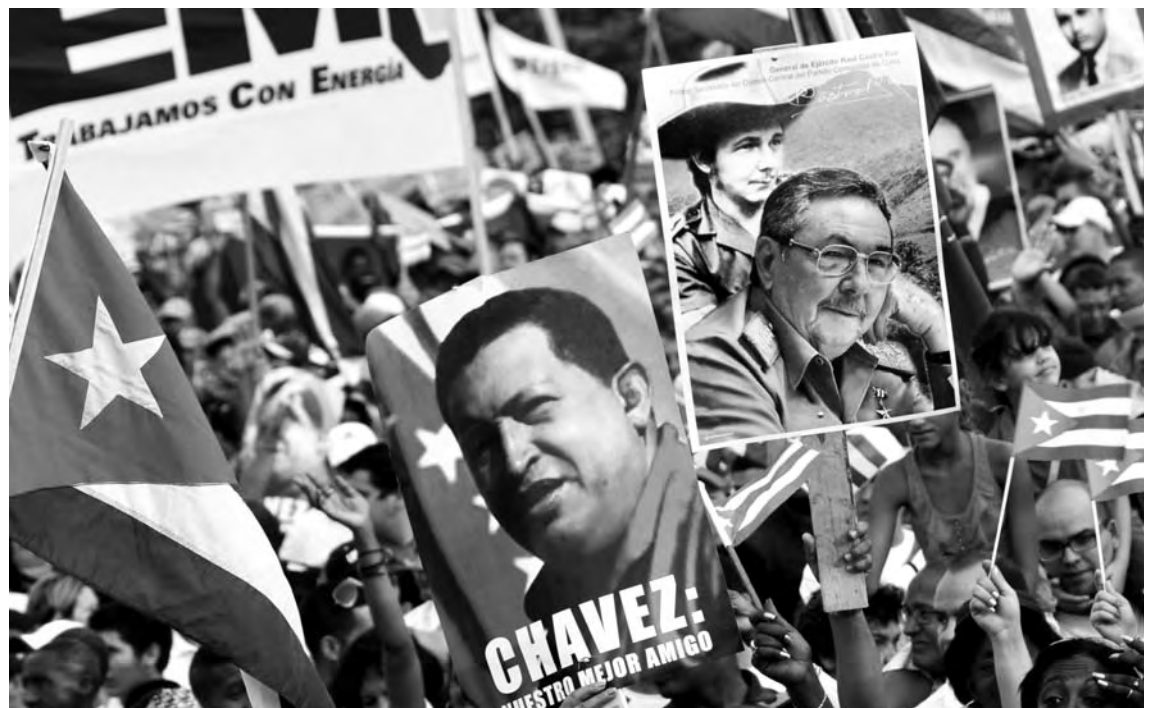
Desfile por el Primero de Mayo, en La Habana.

Emilio Marín / La Arena Cubainformación TV