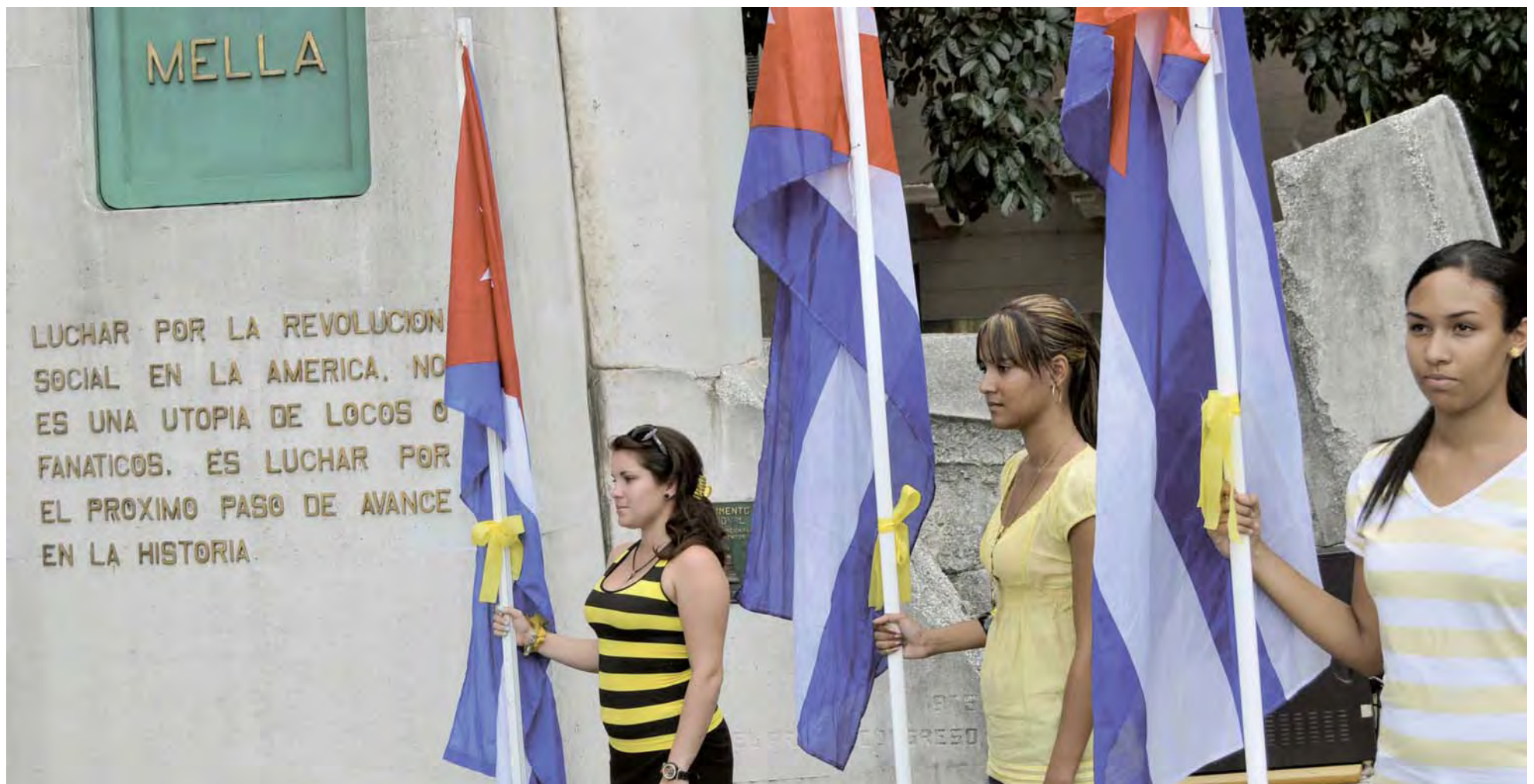
Proyecto colectivo Detrás del muro, como parte de la Oncena Bienal de La Habana, en el malecón habanero, Cuba.