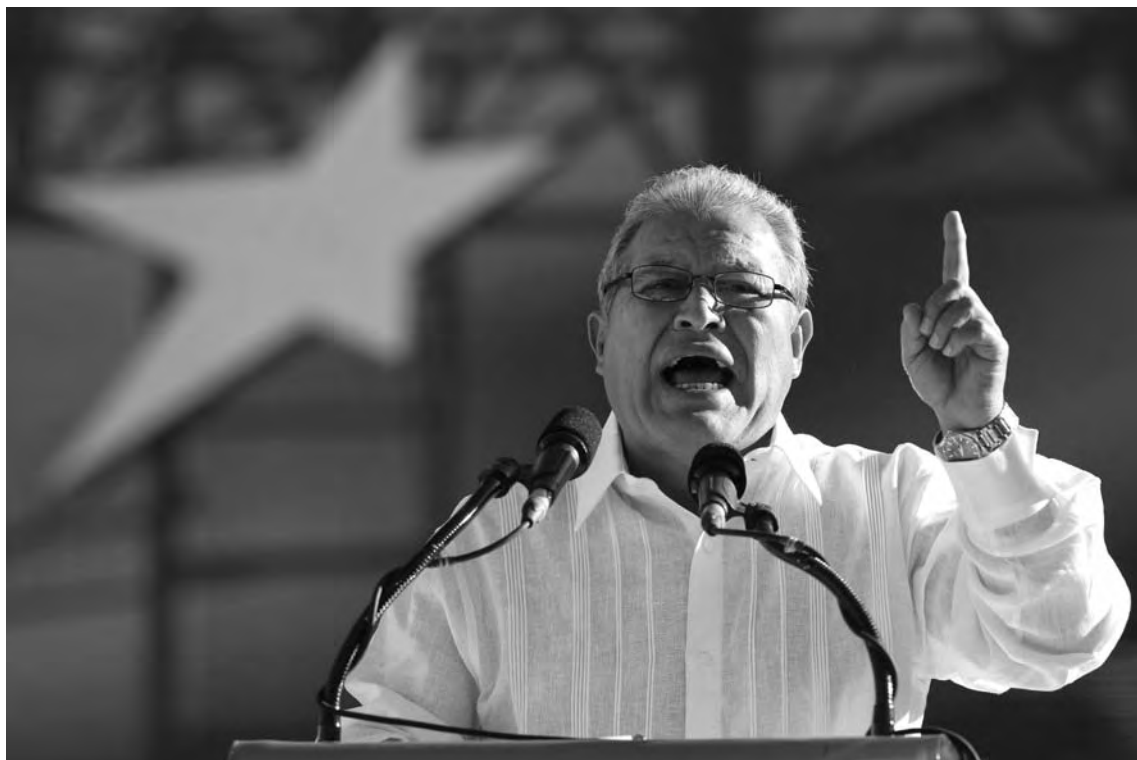
Salvador Sánchez Cerén.

Esta primera Planta de Biofertilizantes de El Salvador, con tecnología cubana a base de hongos micorrizógenos, aumentará el rendimiento de los cultivos, las ganancias para los agricultores, así como