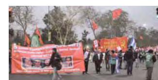
Buenos Aires