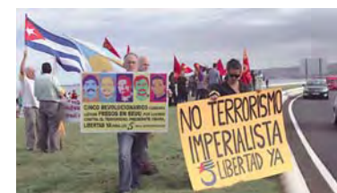
Las Palmas de Gran Canaria