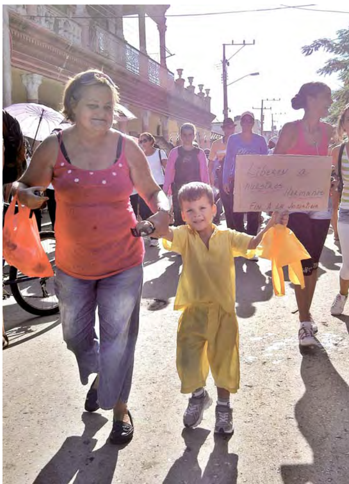
Maratón en Ciego de Ávila.