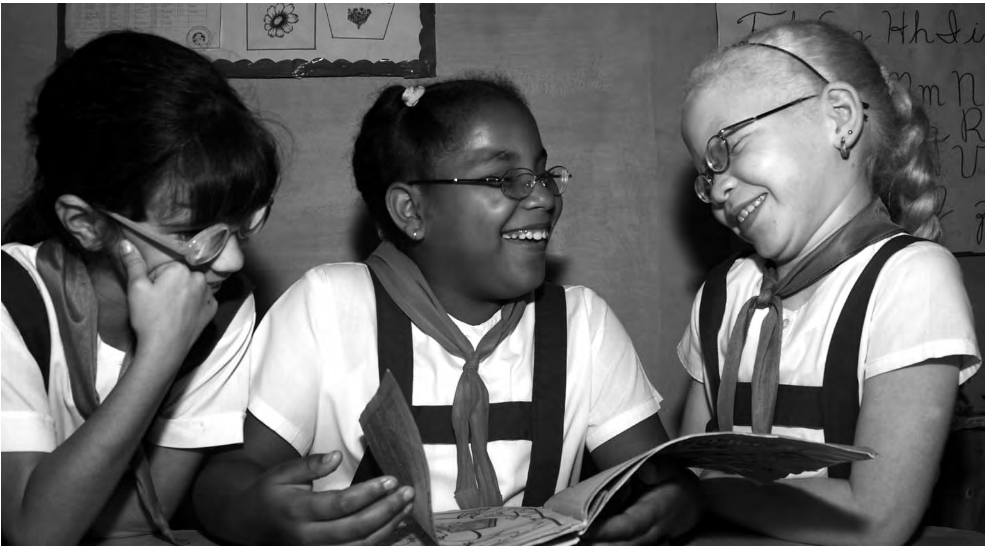
Niñas de la escuela especial de ciegos y débiles visuales Bartolomé Rivas Cedeño, en el municipio de Cienfuegos.