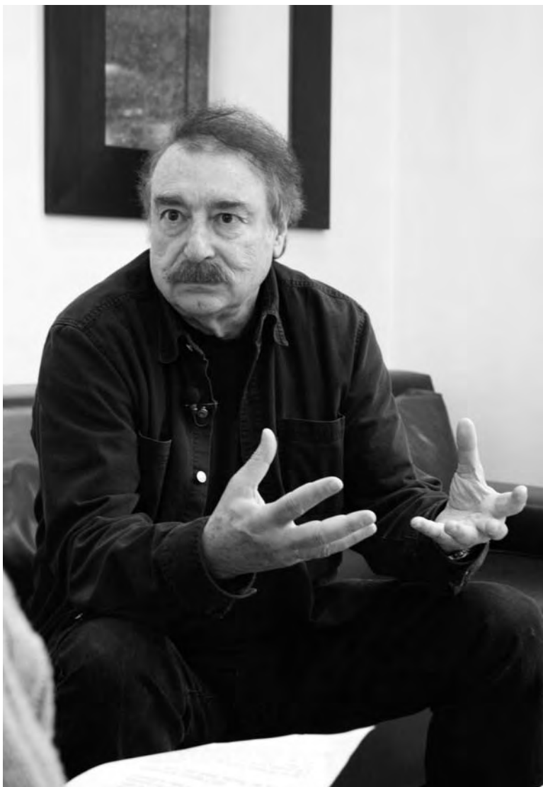
Momentos de la entrevista con Ignacio Ramonet.

Cuando triunfa la Revolución, efectivamente, Alfredo crea el cine cubano. Un cine cubano que le va a permitir llevar a cabo una lucha ideológica muy importante, con la idea de que una cultura socialista no puede ser una cultura dominada por un partido, de manera disciplinada y domesticada. Él va a rechazar lo que estaba de moda entonces en los países socialistas, el realismo socialista. Va a ser criticado por los modernos y por los ortodoxos. Pero esa línea es la que va a triunfar, porque Fidel la hace suya, en 1961, en una