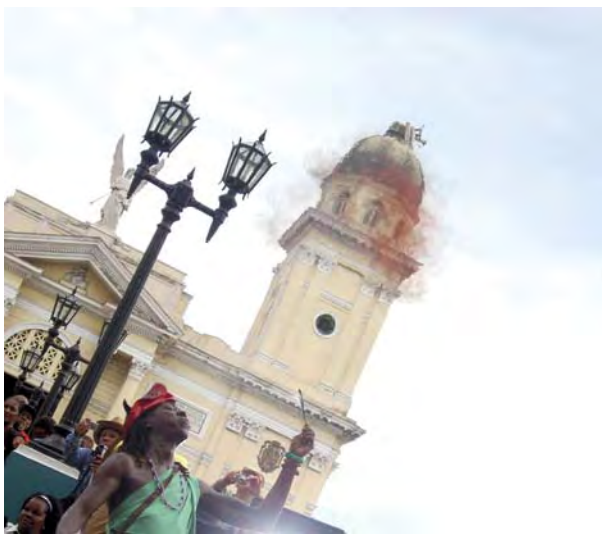
Primer premio: Rosalía Barros Ayala (Santiago de Cuba)

25º Concurso de Fotografía CUBAINFORMACIÓN, (fallado el 16 de septiembre de 2013):