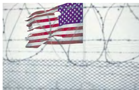
Analistas apuntan a que Donald Trump y Marco Rubio tratan de provocar una crisis

Con ello, se prevé que EEUU incumpla el compromiso firmado con Cuba en 1994, de otorgar al menos 20 000 visas anuales.