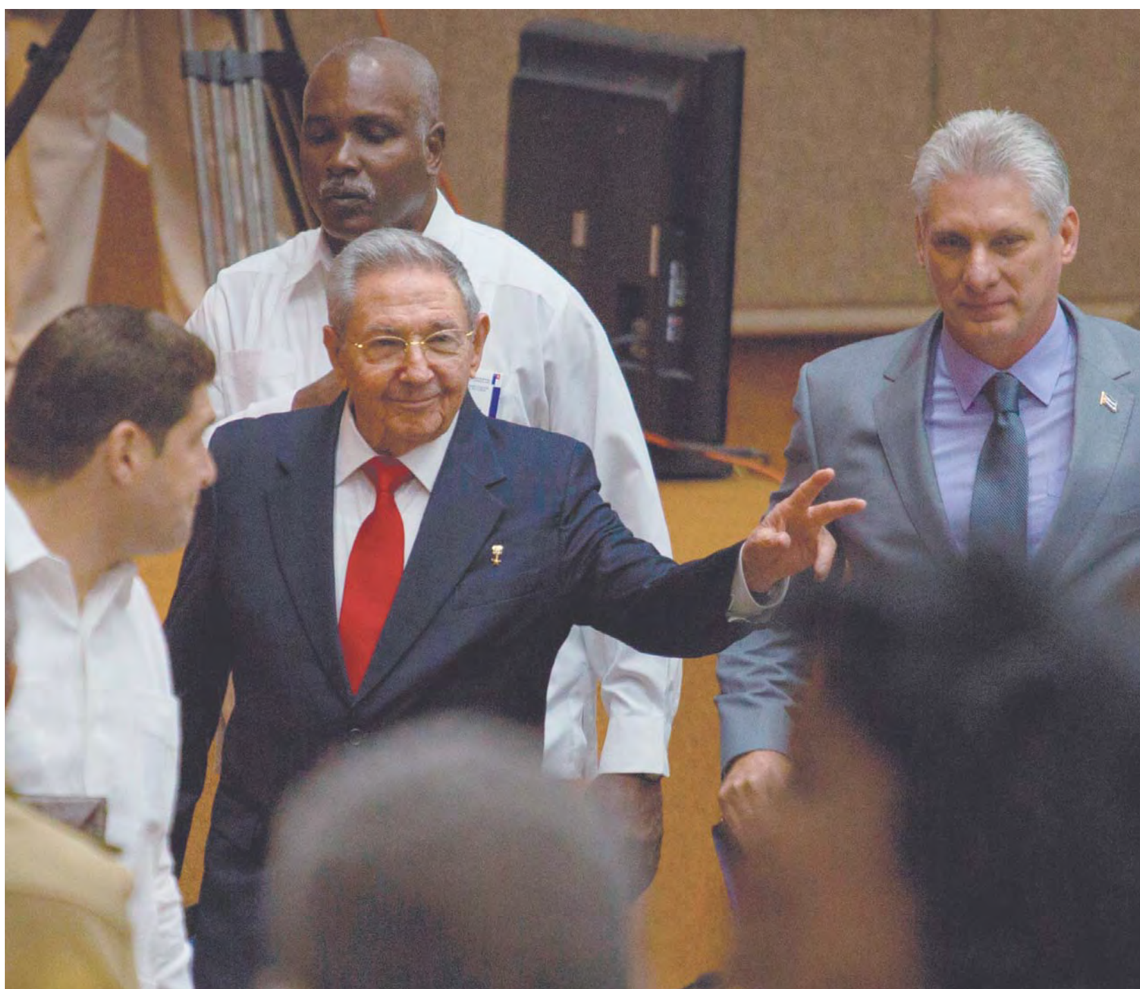
Raúl Castro entra en la Asamblea Nacional seguido de su sucesor, Miguel Díaz-Canel, para el inicio de la sesión legislativa de dos días en La Habana, el 18 de abril de 2018.

Teniendo en cuenta dicho escenario, es probable que el nuevo gobierno cubano tenga que tomar unas u otras decisiones en función de dos lógicas contrapuestas: por un lado, la de la audacia, sostenida por los partidarios de acelerar las reformas como fórmula para superar los obstáculos de la economía; por el otro, la lógica de la prudencia, de aquellos otros que des-