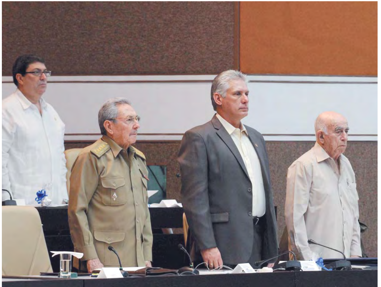
Sesión de la Asamblea Nacional del Poder Popular, el 21 de diciembre de 2017, en La Habana.

No obstante lo anterior, frente a la estrategia de las sanciones contra Cuba que promueven los senadores Marco Rubio y Ted Cruz, y el congresista Mario Díaz-Balart, existe un amplio y diverso grupo de sectores políticos y sociales tanto en Cuba como en Estados Unidos que se oponen a la actual política estadounidense, tanto por intereses puramente económicos, comerciales o por mero sentido común, como por percepciones diferentes acerca de cómo percibir más efi-