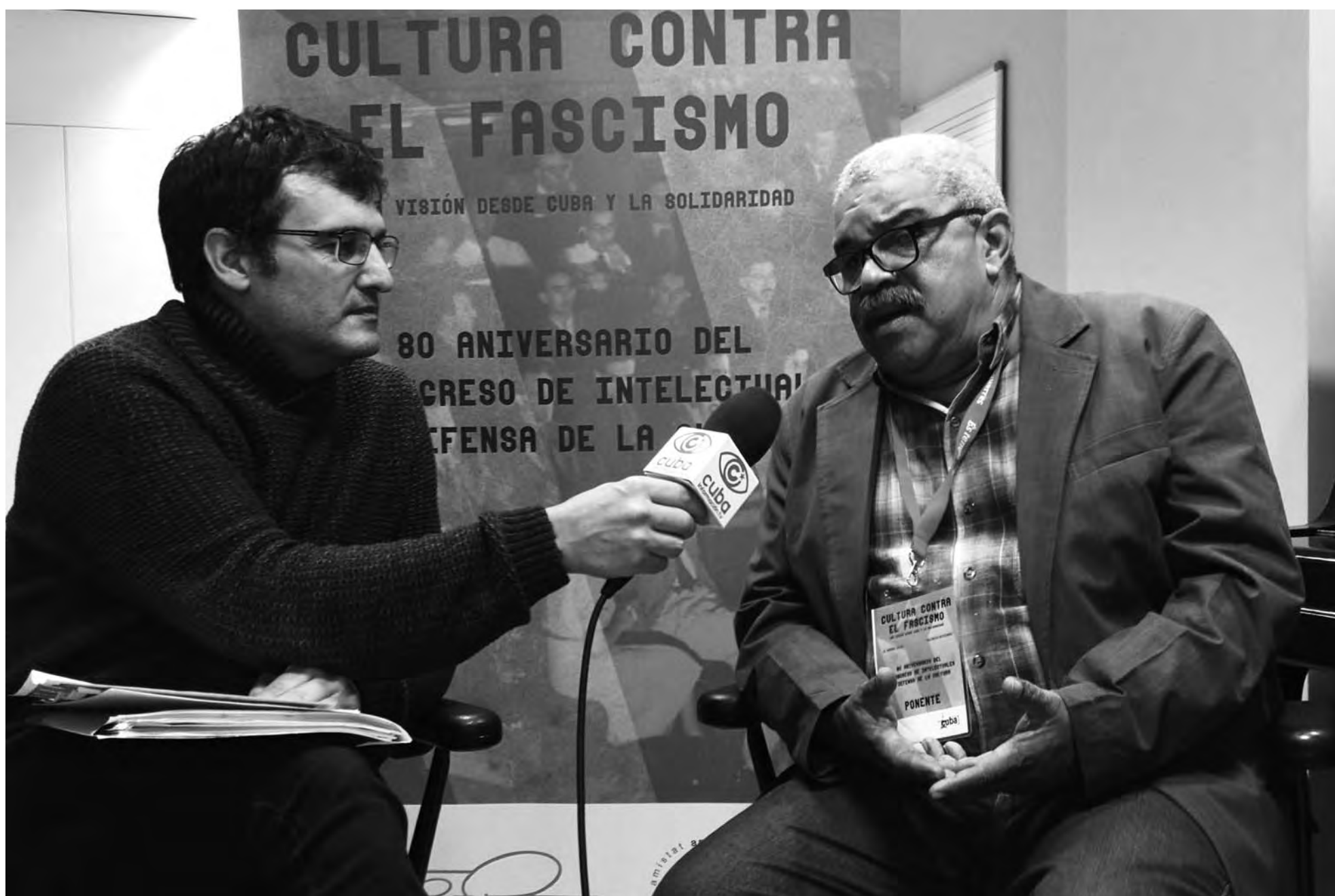
Pedro de la Hoz, vicepresidente de la Unión de Escritores y Artistas de Cuba (UNEAC)