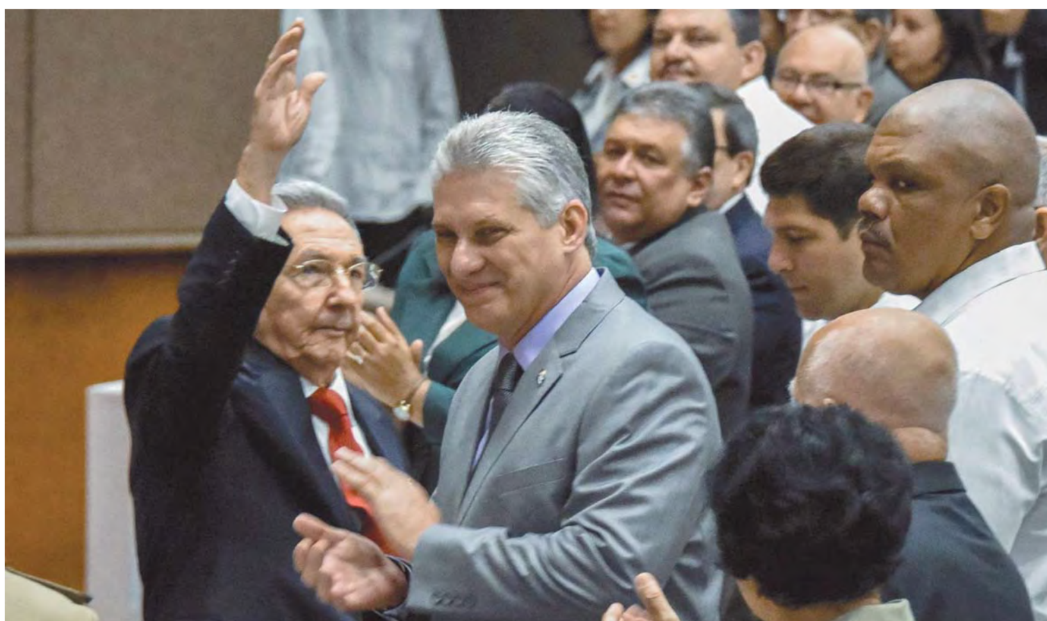
Raúl Castro y Miguel Díaz-Canel, en la clausura de la sesión parlamentaria.

Miguel Díaz-Canel, nuevo Presidente de los Consejos de Estado y de Ministros de Cuba, le ha hablado claro a Donald Trump: "Cuba no negociará principios ni aceptará condicionamientos" ante ninguna presión externa. Ha subrayado que en la Isla "no habrá espacio para quie-