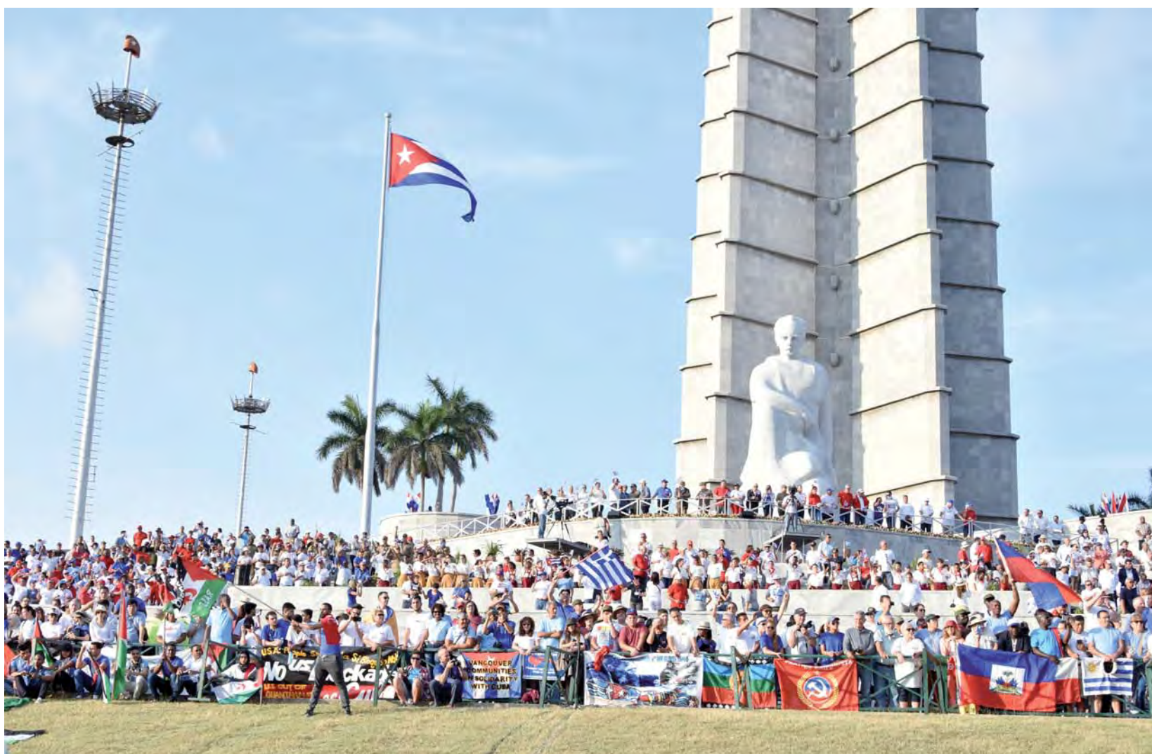
Actos por el 1 de Mayo en la Plaza de la Revolución en La Habana, 2018.

Tras la caída del Muro de Berlín y la desaparición de la Unión Soviética (1989), los profetas de la desgracia anunciaron el fin del socialismo cubano. No podía fallar la teoría del dominó... Se equivocaron. Cuba resistió, soportó el Período Especial (1990-1995) y se adaptó a los nuevos tiempos de la globalización. Muchos se preguntan por qué los Estados Unidos no invadieron a Cuba con tropas convencionales (después de la derrota de los mercenarios), como hicieron en Somalia (1993), Granada (1983), Afganistán (2001), Iraq (2003), Libia (2011), Siria (2017), Níger (2017) y Yemen (2018). La respuesta es sencilla: una potencia bélica es capaz de ocupar un país y derribar su gobierno. Pero no de derrotar a un pueblo. Los estadounidenses aprendieron esa lección dolorosamente en Vietnam, de donde fueron expulsados por un pueblo campe-