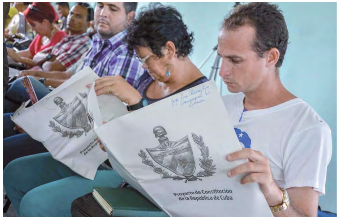
Docentes analizan el proyecto de Constitución, en la ciudad de Las Tunas.

CUBAINFORMACIÓN TV Texto base: Arthur González